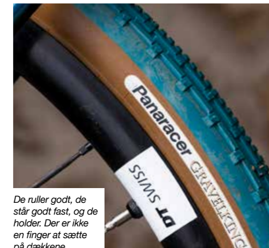
De ruller godt, de står godt fast, og de holder. Der er ikke en finger at sætte på dækkene.

Principia Gravel Carbon kommer i to konfigurationer, henholdsvis G1 og G2. Begge er monterede med Shimanos gravelspecifikke GRX600-geargrupper, og den eneste forskel er, om cyklen har én eller to klinger foran. Den testede cykel havde to klinger i 46/30 foran, hvilket fungerer glimrende kombineret med 11-34 kassetten bagpå. 46-klingen er velegnet til det meste, men bliver det rigtig stejlt, kan du komme op ad alt i 30x34-gearet. Gruppen minder